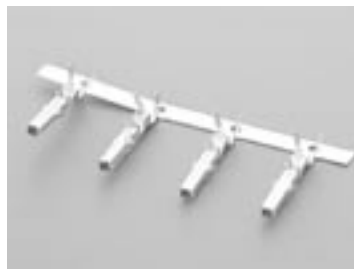
Контакт для разъема